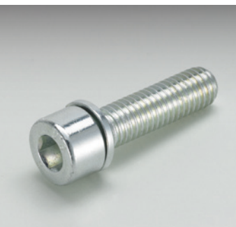
Kombi-Schraube mit Federscheibe Screw-and-washer assembly with spring washer