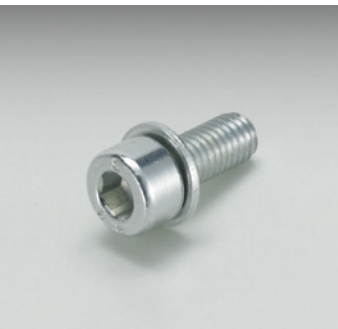
Kombi-Schraube mit flacher Scheibe Screw-and-washer assembly with flat washer