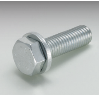
Kombi-Schraube mit Federring Screw-and-washer assembly with spring ring