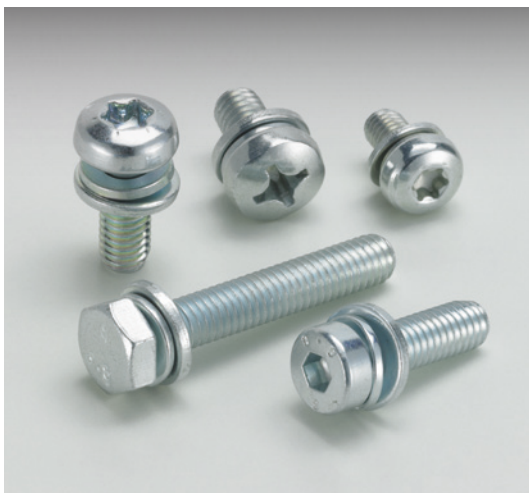
Kombi- und Doppelkombi-Schrauben mit verschiedenen Antriebsformen

Screw-and-washer and double screw-and-washer assemblies with various drive forms